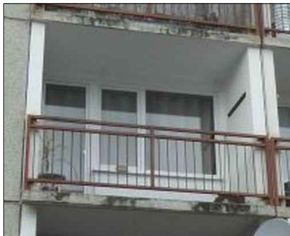
CELKOVÝ POHLED NA ZÁBRADLÍ