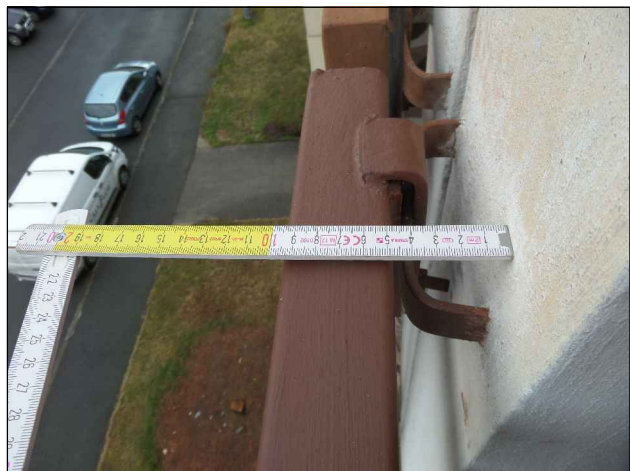
PŮVODNÍ KOTVENÍ, HORNÍ ČÁST